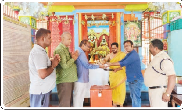
ఇల్లందు, మే 4, ప్రజాజ్యోతి:

పట్టణంలోని 24 ఏరియాలో గల సువర్ణ సహిత అభయ ఆంజనేయ స్వామి దేవాలయ అభివృద్ధికి పౌర విమాన మంత్రిత్వ శాఖ నందు పనిచేసే సమితి సర్కార్ శనివారం