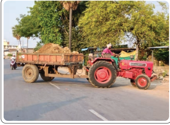
(మొదటి పేజీ తరువాయి)

ఇన్నేళ్లుగా ఎన్నడూ చూడలేదని చుట్టుపక్కల ప్రజలు చెప్పడం విశేషం. మట్టిని వేలాది ట్రీపులు ట్రాక్టర్ లో తరలించడం గమనార్హం. అక్రమ మట్టి దండా మాఫియాదారులు ఇదే అదునుగా చేసుకుని రూ. లక్షలు వెనకేసుకుంటున్నట్లు మండలంలో జోరుగా ప్రచారం జరుగుతుంది. బదా బాబులు పేర్లు చెప్పుకుంటూ అక్రమ మట్టి త్రవ్వకాలకు పాల్పడుతున్నారని విమర్శలు లేకపోలేదు. గుట్టు చప్పుడు కాకుండా జెసిబిల సాయంతో అక్రమ మట్టి దండా నడిపిస్తున్నారు. ఇవన్నీ అధికారులు తెలిసినా పట్టించుకోకపోవడంలో ఏమిటని ప్రజలు ప్రశ్నిస్తున్నారు. రెవెన్యూ, ఆసైన్స్, ఫారెస్ట్ భూములలో సుంచి యదేచ్ఛగా గిరిజన నాయకుల పేర్లు చెప్పుకొని, అక్రమ మట్టి రావాణా దండాలకు పాల్పడి దీపం ఉన్నప్పుడే ఇళ్ళు చక్కబెట్టుకోవాలనే నానుడి మాటను నిజం చేస్తూ నాయకుల అండదండలు ఉన్నప్పుడే నాలుగు పైసలు దాచుకుంటున్నట్లు ఆరోపణలు ఉన్నాయి. వీరి ధన దాహానికి కాలువ గట్టు, కొండలాంటి కాలువలు, గట్టు సైతం తరిగిపోతున్నాయనేది వాస్తవం. అంతేకాకుండా అనుభవం లేని ట్రాక్టర్ డ్రైవర్లతో రాత్రి, పగలు తేడా లేకుండా