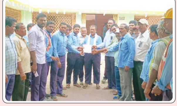
బేకులపల్లి, మే 4, ప్రజాజ్యోతి: