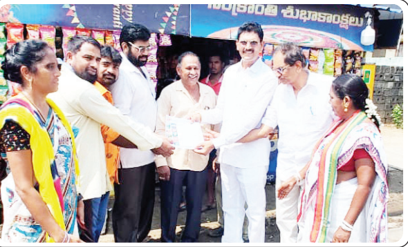
భద్రాచలం, 04 మే, ప్రజాజ్యోతి