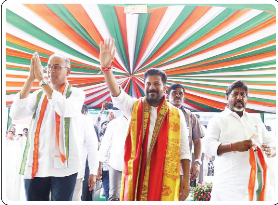
భద్రాద్రి కొత్తగూడెం ప్రతినిధి, మే 04, ప్రజాజ్యోతి