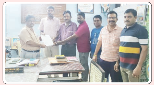
మణుగూరు, మే 4, ప్రజాజ్యోతి: