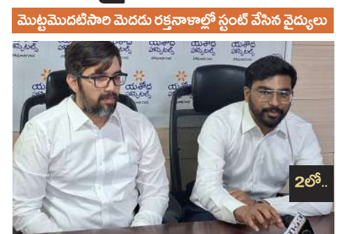
మొట్టమొదటిసారి మెదడు రక్తనాళాల్లో స్టంట్ వేసిన వైద్యులు