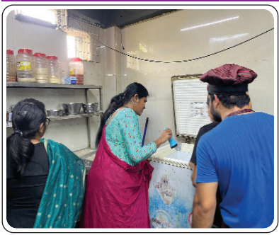
భద్రాచలం, మే 27, ప్రజాజ్యోతి