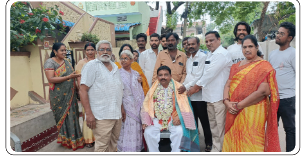
ఇల్లందు, మే 25, ప్రజాజ్యోతి: