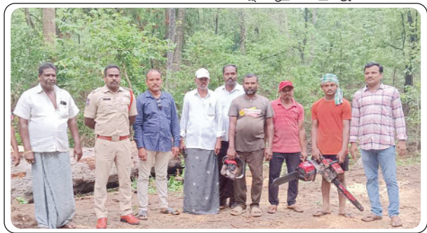
బేకులపల్లి, మే 25, ప్రజాజ్యోతి:

నుంచి తొలగించి రాకపోకలను పునరుద్ధరించారు. సంబంధిత ఆర్ అండ్ బి శాఖ అధికారులు పట్టించుకోకపోయినప్పటికీ ఎస్పీ ప్రత్యేక చొరవ చూపి రోడ్డుకు అడ్డంగా పడివున్న వృక్షాన్ని తొలగించి సకాలంలో రాకపోకలను పునరుద్ధరణ ఎస్పీ చూపిన చొరవను మండల వాసులు, వాహనదారులు హార్షం వ్యక్తం చేస్తున్నారు.