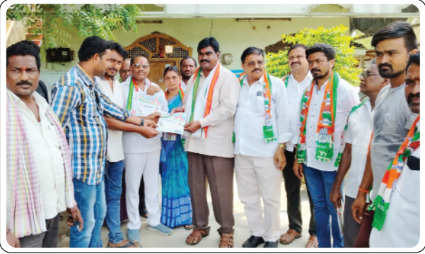
పాల్వంచ, మే 23, ప్రజాజ్యోతి:

తెలంగాణ రాష్ట్రంలోని లక్షలాది మంది నిరుద్యోగులు గత 10 సంవత్సరాల నుండి ఉపాధి అవకాశాలు లేక దుర్భరమైన జీవితం సాగిస్తున్నారని, వారి సమస్యల పరిష్కారంకై కాంగ్రెస్ ప్రభుత్వం తగిన చర్యలు తీసుకుంటుందని, వారికై ప్రీశ్చించే గాంతు తీన్వార్ మల్లన్నేడ్ న డీసీఎంఎస్ చైర్మన్, జిల్లా కాంగ్రెస్ నాయకులు