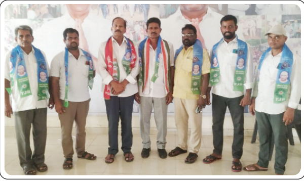
టేకులపల్లి, మే 23, ప్రజాజ్యోతి: