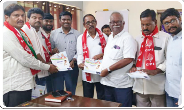
పాల్వంచ, మే 23, ప్రజాజ్యోతి: