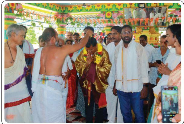
దమ్మపేట, మే 23, ప్రజాజ్యోతి: