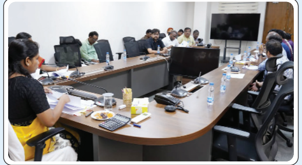
భద్రాద్రి కొత్తగూడెం జిల్లాలో, మే 23 ప్రజాజ్యోతి