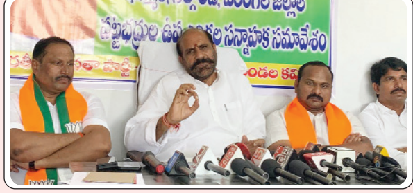
అశ్రావపుపేట, మే 22, ప్రజాజ్యోతి:

- బిజెపి సిద్ధాంతాలను ఇతర దేశాలకు గౌరవించే స్థాయిలో ఉన్నాయి - కాంగ్రెస్ పార్టీ దుష్ప్రచారాలు ప్రజలు నమ్మే స్థితిలో లేవు - బిజెపి క్లస్టర్ ఇన్ చార్జ్ మార్కెటింగ్ నిర్దేశావు