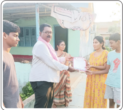
ఇల్లందు, మే 22, ప్రజాజ్యోతి: