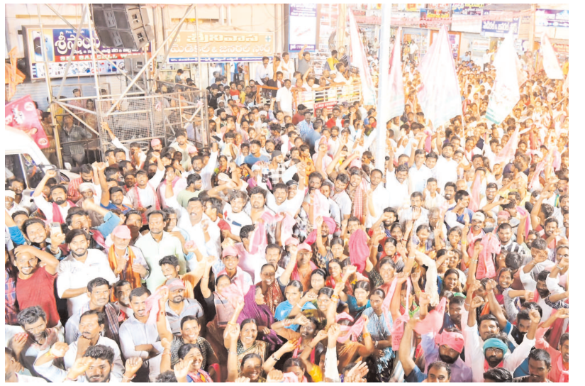
ఖమ్మం ప్రతినిధి మే 1, ప్రజాజ్యోతి.