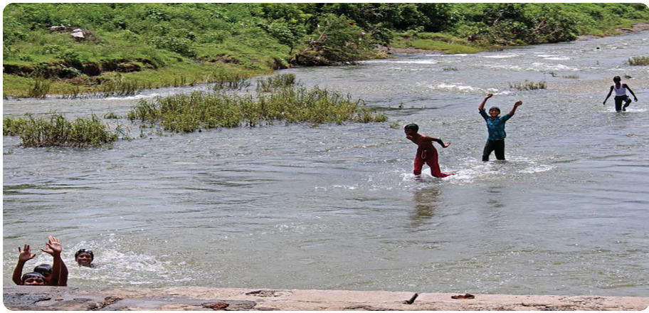
జూలూరుపాడు, ఏప్రిల్ 30, ప్రజాజ్యోతి