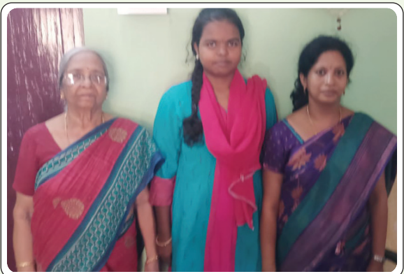
అశ్వారావుపేట, ఏప్రిల్ 30, ప్రజాజ్యోతి:

- పదిఫలితాలలో జవహర్ విద్యార్థుల హవా - మండలంలో 86.9% ఉత్తీర్ణత