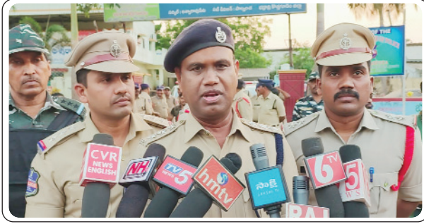
అశ్వారావుపేట, ఏప్రిల్ 30, ప్రజాజ్యోతి: