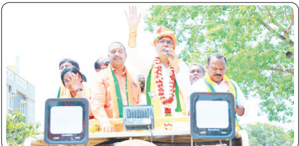
అశ్వారావుపేట, ఏప్రిల్ 30, ప్రజాజ్యోతి:

- కల్లబొల్లి మాటలు కాంగ్రెస్ ను నమ్ముద్దు - మళ్ళీ మోడీనే ప్రధానమంత్రి - తాండ్ర వినోద్ రావు