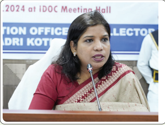
భద్రాద్రి కొత్తగూడెం బ్యూరో, ఏప్రిల్ 30, ప్రజాజ్యోతి

భద్రాద్రి కొత్తగూడెం జిల్లా కలెక్టర్ ప్రియాంక అలా ఆదేశాల మేరకు జిల్లా సంక్షేమ అధికారిని వేల్పుల విజేత ఆధ్వర్యంలో హైదరాబాద్ లోని దుర్గాబాయి దేశ్ ముఖ్ ప్రభుత్వ మహిళా టెక్నికల్ శిక్షణ సంస్థలో పాలిటెక్నిక్ డిప్లొమా కోర్సులకు 2024-25 విద్యా సంవత్సరానికి గాను తల్లిదండ్రులు కోల్పోయిన (అనాధ) బాలికలు, తల్లి లేదా తండ్రి కోల్పోయిన బాలికలు (పాక్షిక అనాధ), నిరుపేద బాలికలు అర్హత కలిగిన వారు దరఖాస్తులు చేసుకోవాలని మంగళవారం ప్రకటనలో తెలిపారు. పదవ తరగతి పూర్తి చేసిన బాలికలు, ఎలాంటి అర్హత పరీక్ష లేకుండా నేరుగా పాలిటెక్నిక్ డిప్లొమా కోర్సులు ప్రవేశాల కొరకు దరఖాస్తు చేసుకోవాల్సిందిగా కోరారు. అర్హత గల బాలికలు పైన తెలిపిన డిప్లొమా కోర్సులు దరఖాస్తు ఫారం నకు సంబంధిత శిశు అభివృద్ధి పథకం అధికారిణులను (సీడిపిఓలు) సంప్రదించాలని సూచించారు. దరఖాస్తు ఫారములను కమిషనరేట్, మహిళాభివృద్ధి, శిశు సంక్షేమ శాఖ, హైదరాబాద్ కు మే 20లోపు పంపాలని తెలిపారు. అర్హత గల బాలికలందరూ ముందస్తుగానే దరఖాస్తు ఫారం నకు సంబంధిత ప్రముఖ త్రాసు జత చేసి, జిల్లా సంక్షేమ అధికారిని, మహిళా, శిశు, వికలాంగుల, వయోవృద్ధుల సంక్షేమ శాఖ కార్యాలయం యందు అనగా జి -11డిఓసీ, పాల్వంచ, భద్రాద్రి కొత్తగూడెం జిల్లా నందు మే 17వ తేదీ సాయంత్రం 5 గంటల లోపు దరఖాస్తులు సమర్పించాలన్నారు. ఇక్కడ నుండి ఎంపికైన బాలికలకు ఉచిత విద్య, వసతి కల్పించబడనని పేర్కొన్నారు.