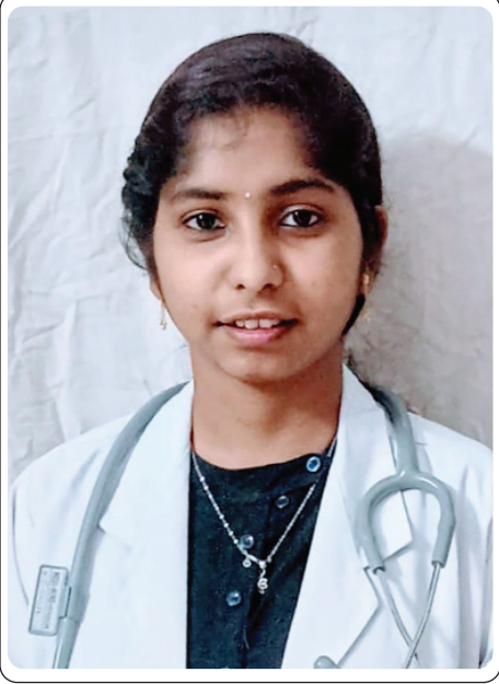
తల్లిదండ్రులు అప్రమత్తతో లేకుండా ప్రమాదాలకు అవకాశం ఉంది అని అన్నారు.

వేసవి కాలంలో పిల్లలను నీటికి దూరంగా ఉండేలా చూడాలని విద్యార్థులు స్నేహితులతో కలిసి సరదాగా ఈతకు వెళ్తుంటారని, కొంత మంది పాత బావుల్లో కూడ ఈతకు పోతుంటారని. వేసవి కాలంలో సరదాగా మిత్రులతో కలిసి ఈత వెళ్లి ప్రాణాల మీదకు తెచ్చుకోవద్దని. ఈ విషయంలో తల్లిదండ్రులు పిల్లలు ఈత కోట్లే ముందు పిల్లల పట్ల పలు జాగ్రత్తలు తీసుకోవాలని. చిన్నారులను నీటికి దూరంగా ఉంచడమే మంచిదని అభిప్రాయం వ్యక్తం చేశారు. ఈ విషయంలో