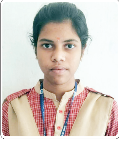
మణుగూరు రూరల్, ఏప్రిల్ 30, ప్రజాజ్యోతి

మంగళవారం వెలుపడిన పది ఫలితాలలో మణుగూరు శ్రీ చైతన్య పాఠశాల అత్యధిక 10 పాయింట్స్ సాధించి జై కేతనం ఎగురవేసింది. శ్రీ చైతన్య పాఠశాలలో ముగ్గురు విద్యార్థులు 10/10 సాధించారని ప్రెస్ నెట్ యుగంధర్ తెలిపారు. తమ