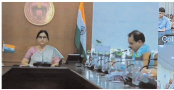
అమ్మ ఆదర్శ పాఠశాలల్లో చేపట్టిన పనులకుంటేని