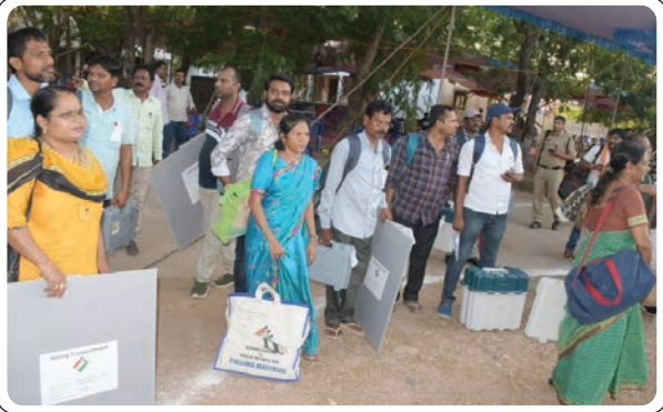
భద్రాచలం, మే 13, ప్రజాజ్యోతి

రాష్ట్రంలో మావోయిస్టు ప్రాంతమైన భద్రాచలం ఏజెన్సీలో సార్వత్రిక ఎన్నికలు ప్రశాంతంగా ముగిసినవి. ఈ ఎన్నికలలో ఎటువంటి అవాంఛనీయ సంఘటనలు జరగకుండా ముందస్తు చర్యల్లో బాగా పోలీసులు సీసీ కెమెరాల ద్వారా డేగ కళ్లతో పర్యవేక్షిస్తూ, సుమారు 5 కిలోమీటర్ల వరకు మావోయిస్టుల కధలికలను వీక్షించగల బయోసెక్యూర్ ఉపయోగించటమే గాక, పారామిలటరీ బలగాలను భారీ యెత్తున మోహరింప జేసి కట్టుదిట్టమైన భద్రత ఏర్పాటు చేసామే. తెలంగాణ చట్టంలో సరిహద్దు దండకారణ్యంలో మావోయిస్టుల మరియు కేంద్రబలగాల భీకర యుద్ధం