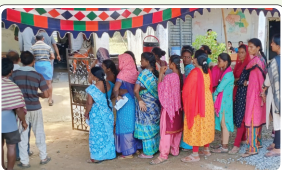
టేకులపల్లి, మే 13, ప్రజాజ్యోతి

పార్లమెంట్ ఎన్నికలలో భాగంగా టేకులపల్లి మండలంలో ప్రశాంత వాతావరణం పోలింగ్ ముగిసింది. సోమవారం టేకులపల్లి మండల వ్యాప్తంగా ఉన్న 44 పోలింగ్ కేంద్రాలలో మొత్తం 41,183 మంది ఓట్లలో పోలింగ్ ముగిచే సరికి 30,455 మంది ఓటర్లు తమ ఓటు హక్కును వినియోగించుకున్నారు. మండలంలో 78.95 శాతం సమీప పోలింగ్ సమోదాంది. ఉదయం 7 గంటలకు ప్రారంభం అయిన పోలింగ్ నక్సల్స్ ప్రభావిత ప్రాంతం కావడంతో సాయంత్రం 4 గంటలకు ముగిసింది. బేతంపూడి గ్రామంలో 153లో పోలింగ్ బూత్ లో విద్యుత్ సరఫరా సరిగా లేకపోవడంతో ఈవిం మొరాయింపగా కొంత అంతరాయం ఏర్పడిన తర్వాత ఓటింగ్ ప్రారంభమైంది. బిర్లగూడెం, జంగలపల్లి, మొట్టగూడెం గ్రామాల ప్రజలు 5 కిలో మీటర్ల దూరం ఉన్న కొప్పురాయి గ్రామ పంచాయతీ పరిధి ఓట్లగూడెం గ్రామంలో ఉన్న ప్రాథమిక పాఠశాలలో ఏర్పాటు చేసిన 137వ పోలింగ్ బూత్ వచ్చి ఓటు వేసేందుకు చాలా ఇబ్బంది పడ్డారు. మొత్తం మీద మండలంలో 4 గంటల వరకు ప్రశాంతంగా పోలింగ్ ముగిసింది.