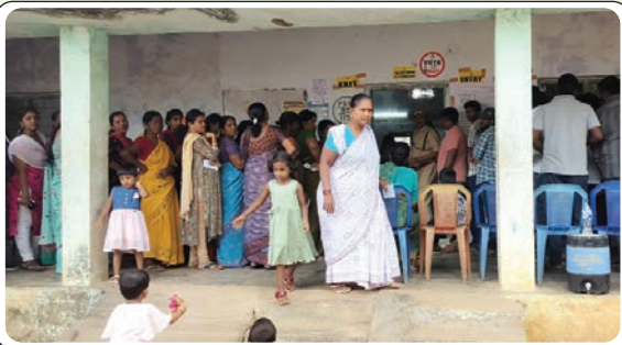
జూలూరుపాడు, మే, 13 ప్రజాజ్యోతి