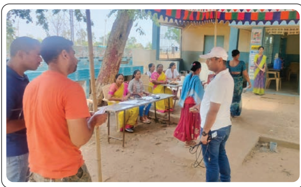
వాతావరణంలో పోలింగ్ జరుగుతుందని వెల్లడించారు.

భద్రాచలం, మే 13, ప్రజాజ్యోతి భద్రాచలం సబ్ డివిజన్లోని చర్ల, దుమ్ముగూడెం మండలాల్లోని మావోయిస్టు ప్రభావిత ప్రాంతాల్లో ఉన్న పోలింగ్ కేంద్రాలను భద్రాచలం ఏఎస్పీ పరితోష్ పంకజ్ సందర్శించారు. ఎప్పటికప్పుడు అక్కడ భద్రాచల ఏర్పాట్లను పరిశీలిస్తూ పోలింగ్ సరళి గురించి అధికారులను అడిగి తెలుసుకోవడం జరుగుతుంది. చర్ల లోని ప్రభుత్వ జూనియర్ కళాశాల, చర్ల మండలం దోసిల్లపల్లి పోలింగ్ బూత్ ల వద్ద బందోబస్తు ను పర్యవేక్షించారు. ఎలాంటి అవాంఛనీయ సంఘటనలు జరగకుండా జిల్లా ఎస్పీ రోహిత్ రాజు సూచనలతో భద్రత బలగాలతో పటిష్టమైన బందోబస్తు ఏర్పాట్లను చేయడం జరిగిందని ఏఎస్పీ ఈ సందర్భంగా తెలియజేశారు. ఏజెన్సీ ప్రాంతాల్లోని ప్రజలంతా స్వచ్ఛందంగా తమ ఓటు హక్కును వినియోగించుకునేందుకు నిర్భయంగా పాల్గొంటున్నారని తెలిపారు. చర్ల, దుమ్ముగూడెం మండలాల్లోని అన్ని పోలింగ్ కేంద్రాల్లో ప్రశాంత