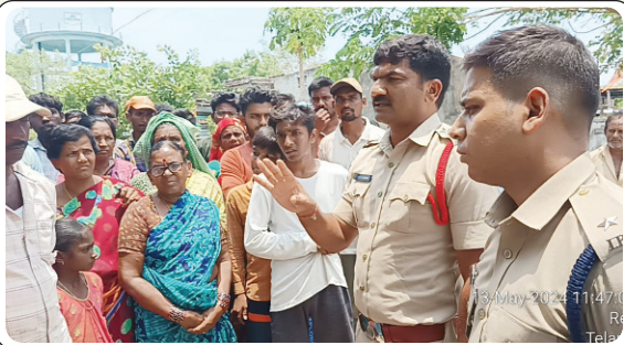
కొత్తగూడెం క్రెమ్, మే 13, ప్రజాజ్యోతి