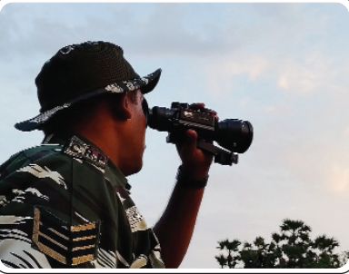
భద్రాచలం, మే 12, ప్రజాజ్యోతి

రాష్ట్రంలో అత్యంత మావోయిస్టు ప్రభావిత భద్రాద్రి ఏజెన్సీలో సోమ వారం జరగనున్న సార్వత్రిక ఎన్నికల కోసం పోలీసులు కట్టుదిట్టమైన భద్రతా ఏర్పాట్లు చేస్తున్నారు. తెలంగాణ-ఛత్తీస్ గడ్డ సరిహద్దు దండకారణ్యంలో ఓ పక్క మావోయిస్టులు, భద్రతా బలగాల మధ్య బీకర యుద్ధం కొనసాగుతున్న వేళ వచ్చిన ఈ ఎన్నికలను సమర్థంగా నిర్వహించేలా పోలీసులు వ్యూహాత్మక అడుగులు వేస్తున్నారు. ఈ క్రమంలో ఏజెన్సీ పై పోలీసులు దృఢీకరణ చేశారు. ఎక్కడికక్కడ పటిష్ట బందోబస్తును ఏర్పాటు చేశారు. డివిజన్లోని చర్ల, దుమ్ముగూడెం మండలాల్లో అత్యంత సమస్యాత్మక కేంద్రాలను ఇప్పటికే పోలీసులు తమ ఆధీనంలోకి తీసుకున్నారు. కొంత కాలంగా దండకారణ్యంలో జరుగుతున్న పరిణామాల నేపథ్యంలో మావోయిస్టులు ఎన్నికల వేళ విధ్వంసాలకు తెగబడతారనే నిఘా వర్గాల సమాచారంతో అదనంగా కేంద్ర