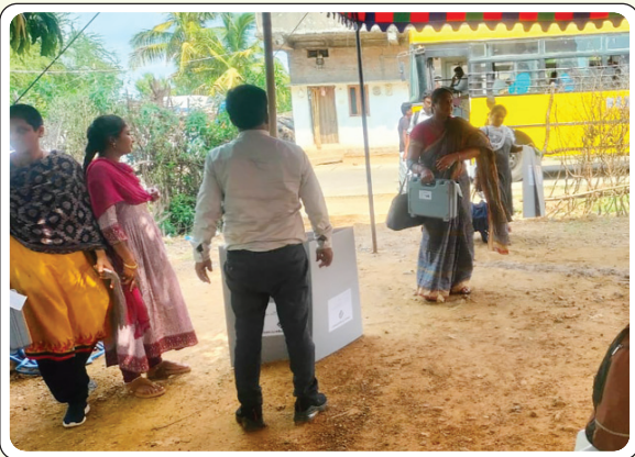
టేకులపల్లి, మే 12, ప్రజాజ్యోతి: