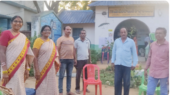
బార్గంపహాడ్, మే 12, ప్రజాజ్యోతి:

బార్గంపాడు మండలంలో పార్లమెంట్ ఎన్నికలకు అధికారులు సర్వం సిద్ధం చేశారు. పార్లమెంట్ ఎన్నికల నేపథ్యంలో ఆరు సెక్టార్లకు గాను 57 పోలింగ్ బూత్లను ఏర్పాటు చేశారు. మండలం మండలంలోని ఆయా గ్రామపంచాయతీలో గల ప్రభుత్వ పాఠశాలలో పోలింగ్ కేంద్రాలు ఏర్పాటు చేయగా పురుషులు స్త్రీలు ఓటు హక్కును వినియోగించుకోనున్నారు. ఉదయం ఏడు గంటలకు పోలింగ్ ప్రారంభం అవుతుందని ఓటు హక్కు కలిగిన ప్రతి ఒక్కరు ఓటు హక్కును వినియోగించుకోవాలి అని సాక్షులు పోలింగ్ బూతులు వద్ద ఏర్పాటు చేయడం జరిగిందని అధికారులు తెలిపారు. మండల వ్యాప్తంగా మొత్తం ఓటర్లు 49813 మంది ఓటు హక్కు వినియోగించుకోనున్నారు. ఎన్నికలు ప్రశాంతంగా జరిగితే గ్రామాల్లో 144 సెక్షన్ అమలు చేస్తున్నట్లు ప్రశాంతమైన వాతావరణంలో ప్రతి ఒక్కరు ఓటు హక్కును వినియోగించుకునేందుకు సహకరించాలని కోరారు.