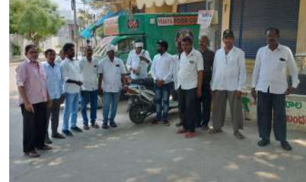
సిరిసిల్ల టౌన్: ఏప్రిల్ 30 (ప్రజా జ్యోతి) రాజన్న సిరిసిల్ల జిల్లా కలెక్టర్ ఆదేశాల మేరకు జిల్లా