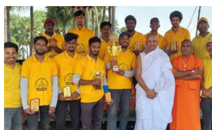
మంగళవారం ఫైనల్ మ్యాచ్ లో విజేతలకు మరియు