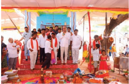
సిద్దిపేట రూరల్ ప్రజాజ్యోతి : సిద్దిపేట ప్రజా సేవలో ఎల్లప్పుడూ అందుబాటులో ఉంటా అని మాజీ మంత్రి

- నిరంతరం మీ సేవలో ఉంటా - మాజీ మంత్రి, ఎమ్మెల్యే హరీష్ రావు