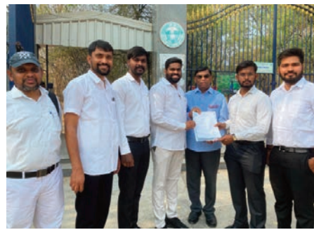
హైదరాబాద్, ఏప్రిల్ 04 (ప్రజా జ్యోతి) : తెలంగాణ