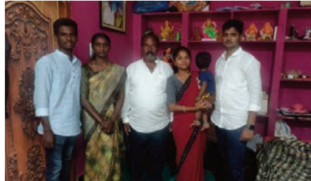
శివంపేట ప్రజాజ్యోతి: శివంపేట మండలం గూడూరు గ్రామంలో ముస్లిం సోదరుల రంజాన్ ఉపవాస దీక్షల