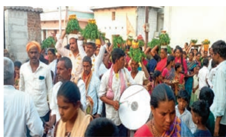
అల్లదుర్గం ఏప్రిల్ 25 (ప్రజాజ్యోతి) అల్లదుర్గం

మండల కేంద్రంలో వెలసిన బేతాళ స్వామి దేవాలయం శీతాశ్రమ ప్రతి సంవత్సరం లాగే ఈ సంవత్సరం జాతర ఉత్సవాలు ప్రారంభమయ్యాయి ఈ ఉత్సవాల్లో భాగంగా గురువారం రెండవ రోజు పోచమ్మ దేవతకు బోనాలు అందంగా అలంకరించి ఆటపాటలతో భాజా భజనీయుల సదుమ పురవీధుల గుండా ఊరేగింపుతో పోచమ్మ దేవాలయానికి చేరుకొని ఐదు ప్రదక్షిణలు చేసి బోనాలను సమర్పించి మొక్కులు చెల్లించుకున్నారు. ఈ కార్యక్రమంలో గ్రామ ప్రజలు అధిక సంఖ్యలో పాల్గొన్నారు.