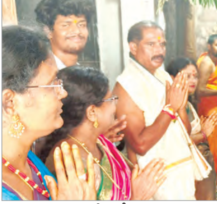
* 108 కలుశాలతో ప్రత్యేక పూజలు * మారుమోగిన ఎల్లమ్మ నామస్మరణం