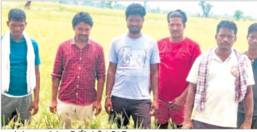
* ప్రభుత్వాన్ని డిమాండ్ చేసిన ఏఎస్ఎస్ రాయ్ అధ్యక్షులు

వెంకటాపురం, ఏప్రిల్ 20 (ప్రజాజ్యోతి): ములుగు జిల్లా వెంకటాపురం మండలంలో వాలెంపాన ప్రాజెక్టు ను సమ్మి కొని రైతులు వేసిన వందలాది ఎకరాల వరి పంటలలో పాలు, మిర్చి, మొక్కజొన్న పంటలు కూడా ఎండి పోయాయి ఏఎస్ఎస్ రాయ్ అధ్యక్షులు కొడుకల వారాలతో తెలియజేశారు. శనివారం ఆయన రైతులతో పాటు బర్లగూడెం పంచాయతీ లోని వరి పంటలను పరిశీలించు