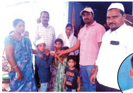
బషీరాబాద్ ఏప్రిల్ 01 ప్రజా జ్యోతి