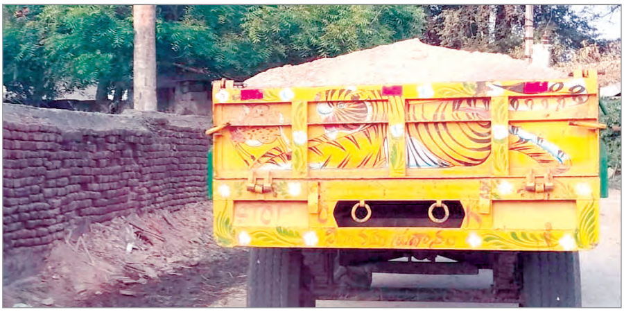
మరిపెడ, ఏప్రిల్ 17 (ప్రజా జ్యోతి): మరిపెడ మండలం భూ కృతండ్ గ్రామసంచాయితీ పరిధిలోని తిజవత్ తండా సమీపంలోని ఆకేరు వారు డంపింగ్ నుంచి కొందరు వ్యక్తులు నిత్యం ఎదుల సంఖ్యలో అక్రమంగా ఇసుక తరలిస్తున్నా

★ అడుగుంటున్న భూగర్భ జలాలు ★ పట్టించుకోని సంబంధిత అధికారులు