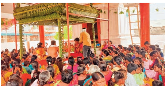
ధారుర్ ఏప్రిల్ 17(ప్రజా జ్యోతి) మండలంలో శ్రీరామనవమి వేడుకలు బుధవారం ఘనంగా

నిర్వహించారు. అంజనేయ స్వామి, రామాలయంలో ఆలయ అర్చకులు ల ఆధ్వర్యంలో స్వామి వారి కల్యాణం ఘనంగా నిర్వహించారు. స్వామివారి కల్యాణానికి భక్తులు అధిక సంఖ్యలో హాజరయ్యారు. గ్రామాలలో ఉదయం గ్రామ ప్రజలు భజనలు చేస్తూ పాటలు పాడుతూ కార్యక్రమం నిర్వహించారు. సీతారామ కల్యాణ మహోత్సవంలో పాల్గొనడం పూర్వజన్మ సుకృతం గా భావిస్తున్నట్లు భక్తులు అన్నారు. తీర్థ ప్రసాదాలు స్వీకరించి భోజనాలు చేశారు.