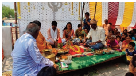
బషీరాబాద్ ఏప్రిల్ 17 ప్రజా జ్యోతి శ్రీరామనవమి పురస్కరించుకొని బషీరాబాద్ మండలంలో పలు గ్రామాలలో మార్చోగిన శ్రీరామ నామం, బుధువారం రోజు బషీరాబాద్ మండలంలో కేంద్రంలో హనుమాన్ దేవాలయంలో, జీవన్మి గ్రామాలలో హనుమాన్ మందిరంలో అంగరంగ వైభవంగా పూజారులచే వేద