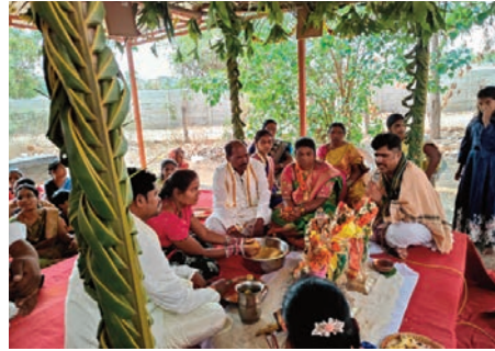
మొయినాబాద్, ఏప్రిల్ 17 (ప్రజా జ్యోతి): మొయినాబాద్ మండల పరిధిలోని యెన్కెపల్లి

- శ్రీరామ నామస్మరణతో మారు మ్రోగిన యెన్కెపల్లి