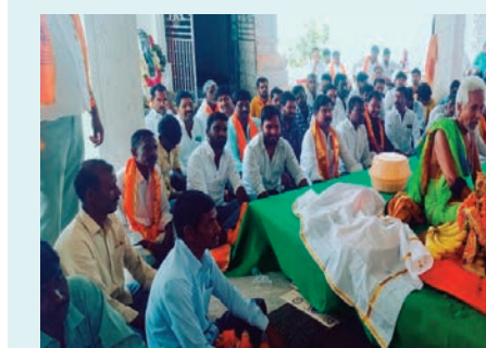
చేవెళ్ల ఏప్రిల్ 17(ప్రజా జ్యోతి): చేవెళ్ల మండలం ముడిమ్యాల గ్రామంలోని శ్రీ కోదండ రామాలయంలో శ్రీరామ నవమి పర్వదినాన్ని పురస్కరించుకొని వైభవంగా సీతారాముల కల్యాణం

- భక్తి పారవశ్యంలో మునిగితేలిన భక్తులు - శ్రీరామస్మరణతో మార్చోగిన గ్రామం