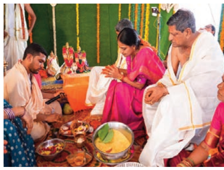
యాచారం, ఏప్రిల్ 17 (ప్రజాజ్యోతి): సీతారాముల కళ్యాణోత్సవం అంగరంగవైభవంగా నిర్వహించారు.