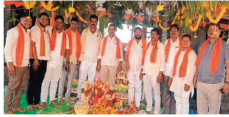
సందిగామ, ఏప్రిల్ 17(ప్రజాజ్యోతి) సీతారాముల కల్యాణం పురస్కరించుకుని సందిగామ మండల

- స్వామి వారికి పట్టు వస్త్రాలు సమర్పించిన గిరిజనులు