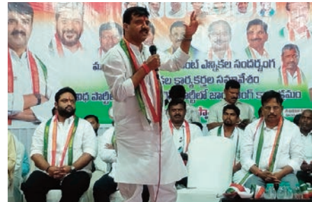
మహబూబ్ నగర్ ఏప్రిల్ 16 ( ప్రజా జ్యోతి బ్యూరో )

- ఒకటి రెండు రోజుల్లో గార్ల పైసలు ఇప్పిస్తాం మాదే బాధ్యత