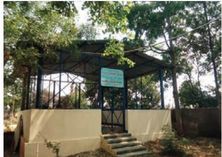
నవాబుపేట్ ఏప్రిల్ 13 (ప్రజా జ్యోతి) నవాబుపేట్ మండల కేంద్రంలోని ఆయుష్ వైద్యశాల ఆధ్వర్యంలో

ఏర్పాటుచేసిన యోగశాలలో ఇప్పటివరకు యోగ శిక్షణ అందించడానికి ఒక్కరు కూడా లేరని మండల కేంద్రంలోని ప్రజలు అంటున్నారు. యోగశాలను ఏర్పాటు చేసి సుమారు 6 నెలలు గడుస్తున్నా ఇప్పటివరకు ఒక్కరిని కూడా నియమించకపోవడంపై ప్రజలు ఆవేదన వ్యక్తం చేస్తున్నారు. ప్రజల ఆరోగ్యం కోసం ఏర్పాటుచేసిన ఈ యోగ శాలలో ప్రభుత్వము స్పందించి ఒక సిబ్బందిని నియమించాలని అంటున్నారు. యోగ ద్వారా కూడా కొన్ని రకాల వ్యాధులు కూడా నయమయ్యే అవకాశం ఉందని, ఉన్నత స్థాయి అధికారులు స్పందించి యోగ శిక్షణ అందించేందుకు ఒకరిని నియమించాలని ప్రజలు అంటున్నారు.