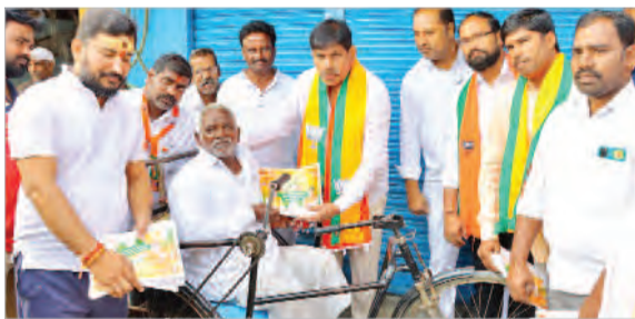
అంబోల్, ఏప్రిల్ 12, (ప్రజాజ్యోతి) :

-మల్కాజిగిరి వాక్ పేరుతో చారిత్రాత్మక కట్టడమైన క్లాక్ టవర్ నుండి పట్టణంలో ప్రచారం ఘరూ -ప్రజల మద్దతు కోరుతూ.. కరపత్రాలు పంపతూ.. జీరుగా సాగిన ప్రచారం