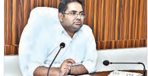
నారాయణపేట జిల్లా ప్రతినది ప్రజాజ్యోతి ఏప్రిల్ 12 :

రూ.1.8 కోట్ల విలువగల సీఎంఆర్ జయ్యాన్ని పక్కాచారి