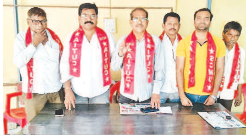
యాజమాన్యం రిటైర్మెంట్ రోజు సిపిఆర్ఎంఎస్ కార్యక్రమానికి సిద్ధంగా ఉంది, 2018 నుండి