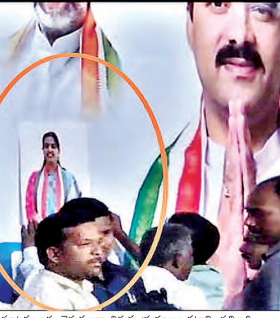
పారపాటు ఎవరిది..? మాటలు అడ్డు చెప్పకుండా తిరుగు ప్రయాణం కట్టాల్సి వచ్చింది.