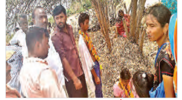
కల్వకుర్తి అగస్టు 12 (ప్రజాజ్యోతి)