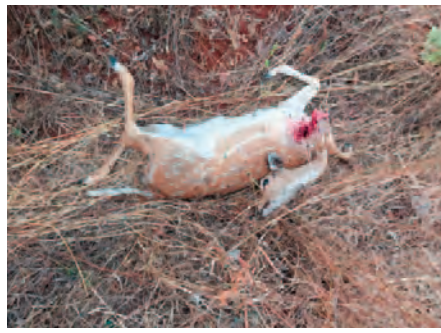
వికారాబాద్ ప్రతినిధి, ఏప్రిల్ 11 (ప్రజా జ్యోతి): కుక్కల దాడిలో జింక మృతి చెందిన సంఘటన అనంతగిరి అటవీ ప్రాంతంలో గురువారం సాయంత్రం జరిగింది. అనంతగిరి జింక సర్కిల్ సమీపంలో రోడ్డు దాటుతున్న జింకను అడవిలో

తిరుగుతున్న కుక్కలు వెంబడించి దాడి చేశాయి. రోడ్డు దాటే క్రమంలో అటువైపు రోడ్డును తొలిచిన గుట్ట ప్రాంతం ఎత్తుగా ఉండడంతో జింక కుక్కలకు చిక్కడంతో దాడి చేసి చంపేశాయి. వేసవి కావడంతో దాహం తీర్చుకోవడం కోసం జింకలు అడవి అంచుకు రావడంతోనే కుక్కలు దాడి చేస్తున్నాయనే ఆరోపణలో వినిపిస్తున్నాయి. జింకలకు కావలసిన నీళ్లు అందుబాటులో ఉంచుతున్నాము: అడవిలో సాసర్ ఫీల్డ్లో జింకలకు కావలసిన నీళ్లు అందుబాటులో ఉంచుతున్నామని ఫారెస్ట్ సెక్షన్ అధికారి అరుణ తెలిపారు. జింక మృతి చెందిన ప్రాంతంలో కావలసినన్ని నీళ్లు ఉన్నాయని ఆ ప్రాంతంలో జింకలు ఎక్కువగా ఉండడంతో కుక్కలు అక్కడే తిప్పి వేసి సమస్యగా మారాయని అన్నారు. ఉన్నతాధికారుల దృష్టికి తీసుకెళ్లి కుక్కల బెడద తగ్గించడానికి చర్యలు తీసుకుంటామని అన్నారు.