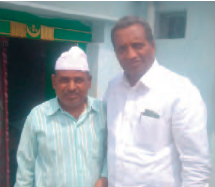
యాలాల్ ఏప్రిల్ 11 ప్రజా జ్యోతి పవిత్ర రంజాన్ పండుగను పురస్కరించుకొని యాలాల మండలంలో పలు గ్రామాలలో గురువారం వారి ఇంటికి నేరుగా

- మతసామరస్యానికి ప్రతీక రంజాన్ - కఠోర ఉపవాస దీక్షలు.. అల్లా దీవెనలు - ఎంపీపీ బాలేశ్వర గుప్తా