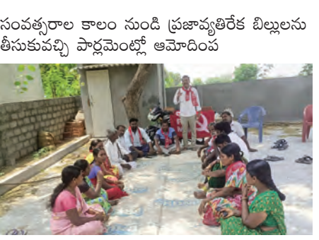
చేసుకుంటున్నారని అన్నారు. దేశంలో ప్రజాస్వామ్యం అత్యంత ప్రమాదంలో పడిందని, భారత