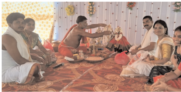
తిరుమలాయపాలెం, ఏప్రిల్ 17, ప్రజా జ్యోతి :