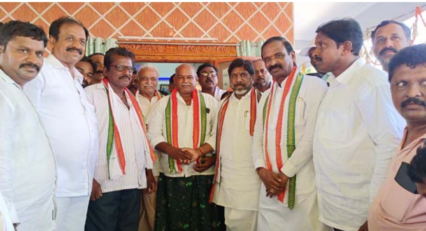
మధిర ఏప్రిల్ 5 ప్రజా జ్యోతి