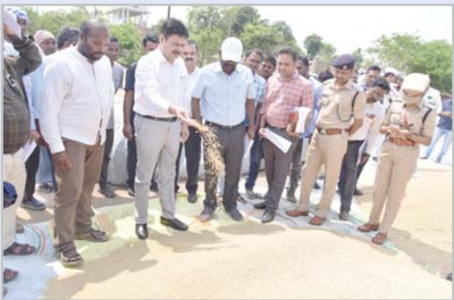
నిజామాబాదు అర్బన్ ప్రజాజ్యోతి ఏప్రిల్ 16: