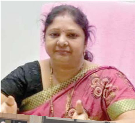
కాంగ్రెస్ కండువా కప్పుకున్నారు. ఇలా