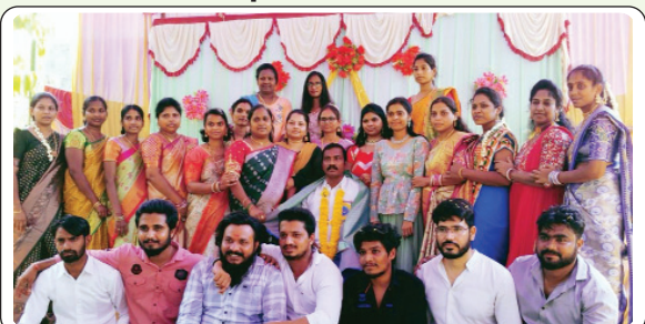
పాల్వంచ, ఏప్రిల్ 29, ప్రజాజ్యోతి: