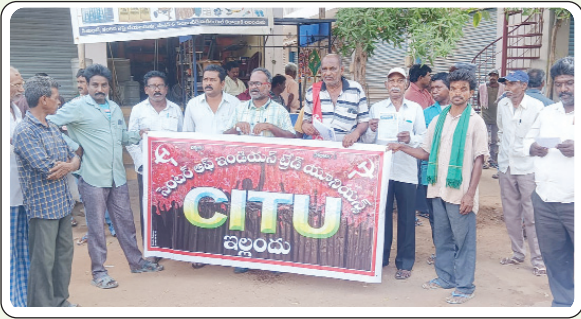
ఇల్లండు, ఏప్రిల్ 29, ప్రజాజ్యోతి: