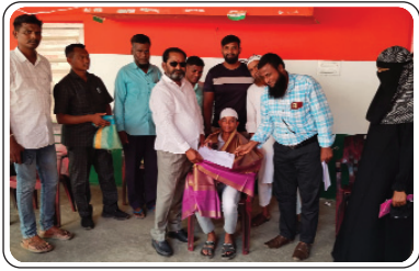
ఇల్లందు, ఏప్రిల్ 29, ప్రజాజ్యోతి:

ఇంటర్ ఫలితాలలో ఇల్లందు మైనారిటీ జూనియర్ బాలర కళాశాల విద్యార్థులు అత్యుత్తమ ఫలితాలు సాధించడంతో సోమవారం ఎమ్మెల్యే క్యాంపు కార్యాలయంలో ఎమ్మెల్యే కోరం కనకయ్య విద్యార్థులను అభినందించారు. ఇంటర్ మొదటి