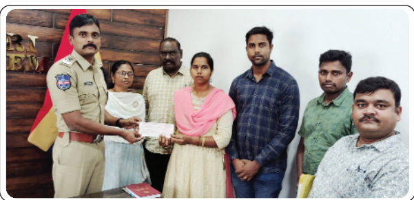
కొత్తగూడెం క్రైమ్, ఏప్రిల్ 29, ప్రజాజ్యోతి