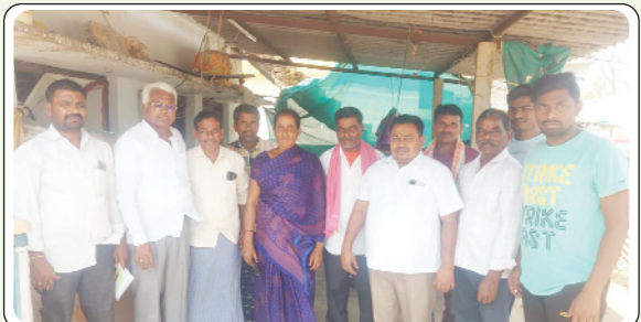
ఇల్లండు, ఏప్రిల్ 29, ప్రజాజ్యోతి: