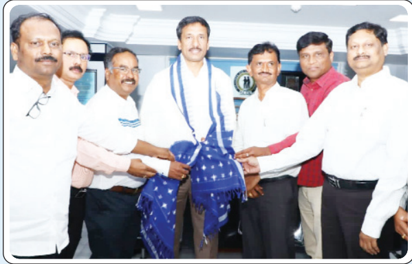
కొత్తగూడెం, ఏప్రిల్ 01, ప్రజాజ్యోతి:

పట్ల సి అండ్ ఎం డి హార్వం - సి & ఎం డి ఎన్ బలరాంను సన్మానించిన అధికారుల సంఘం