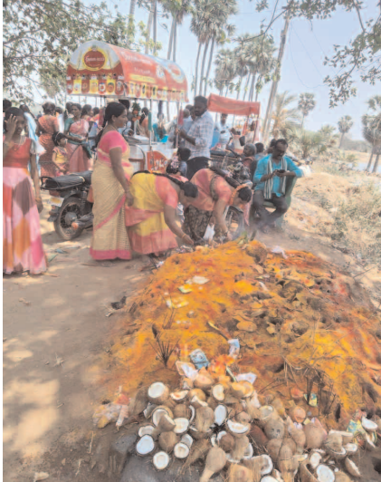
సభ్యులు, పోగ్రెసివ్ జర్నలిస్ట్ అసోసియేషన్ తెలంగాణ