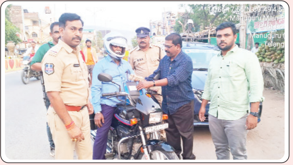
మణుగూరు రూరల్, ఏప్రిల్ 26, ప్రజాజ్యోతి