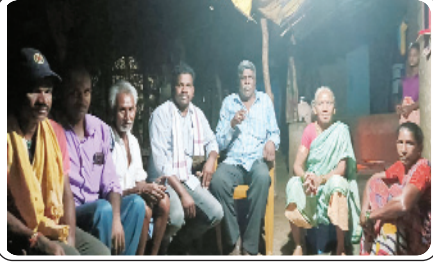
మణుగూరు రూరల్, ఏప్రిల్ 26, ప్రజాజ్యోతి:

- రహదారిపై ఇసుక, బొగ్గు లారీల అతివేగాన్ని అరికట్టాలి..