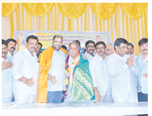
ప్రముఖులు శాలువాలతో సత్కరించి హృదయపూర్వక శుభాకాంక్షలు తెలిపారు.

గా తొక్కి పెట్టారు. కులగణన చేపట్టాలని అన్ని వర్గాల ప్రజల నుంచి డిమాండ్ పెద్ద ఎత్తున వినిపిస్తున్నా మోడీ పట్టించుకోవడం లేదు. కులగణన, బీసీ, మహిళా రిజర్వేషన్స్ అమలు జరగాలంటే బీఆర్ఎస్ ఎంపీలను గెలిపించుకోవాలని నామ నాగేశ్వరరావు వంటి బలమైన నాయకుడు పార్లమెంటులో ఉంటేనే ప్రజల న్యాయమైన హక్కులకు పరిష్కారం దొరుకుతుంది. ఎస్సీ, ఎస్టీ, బీసీ, మైనారిటీలు బీఆర్ఎస్ కు సంపూర్ణ మద్దతునిచ్చాం నామను భారీ ఓట్ల మెజారిటీతో గెలిపించేందుకు మనమందరం కలిసికట్టుగా ముందుకు సాగుదాం ఈ కార్యక్రమంలో “జై తెలంగాణ జై జై తెలంగాణ”, “జై యాదవ జై జై యాదవ”, “బీఆర్ఎస్ లోకనభ అభ్యర్థి నామ నాగేశ్వరరావు కారు గుర్తుకే మన ఓటు”, “గెలిపిద్దాం గెలిపిద్దాం నామ నాగేశ్వరరావును భారీ ఓట్ల మెజారిటీతో గెలిపిద్దాం” అంటూ పెద్ద పెట్టున నినాదాలు చేశారు. ఈ సందర్భంగా రాజ్యసభకు తిరిగి ఏకగ్రీవంగా ఎన్నికై పదవీ ప్రమాణం చేసిన వద్దిరాజు రవిచంద్రను పలువురు యాదవ