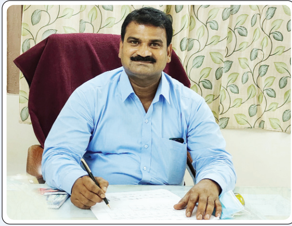
మణుగూరు రూరల్, ఏప్రిల్ 22, ప్రజాజ్యోతి: