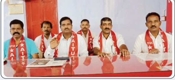
మణుగూరు రూరల్, ఏప్రిల్ 22, ప్రజాజ్యోతి: