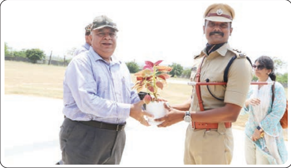
భద్రాద్రి కొత్తగూడెం బ్యూరో, ఏప్రిల్ 22, ప్రజాజ్యోతి

- భద్రాద్రి, ములుగు, భూపాలపల్లి జిల్లాల పోలీస్ అధికారులతో సమీక్షా సమావేశం - రాబోయే పార్లమెంటు ఎన్నికలు సజావుగా జరిగేలా అధికారులంతా సమన్వయంతో పనిచేయాలి