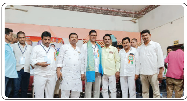
ఇల్లందు, ఏప్రిల్ 21, ప్రజాజ్యోతి: