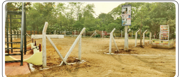
ఇల్లందు, ఏప్రిల్ 21, ప్రజాజ్యోతి:

- కబ్బాలకు గురవుతున్న వైఎం చిత్తల షిరూ...?