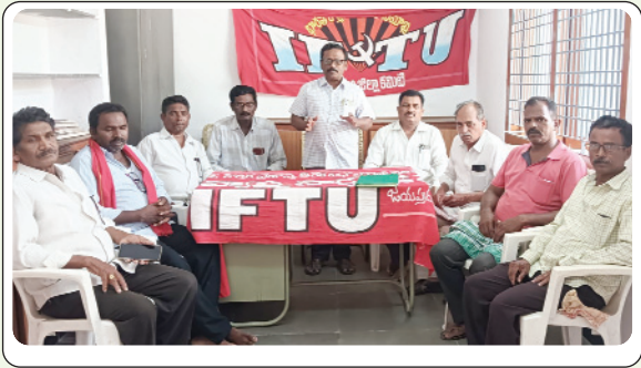
ఇల్లందు, ఏప్రిల్ 21, ప్రజాజ్యోతి: