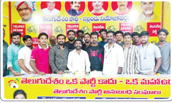
నాయుడు ఆత్మవిశ్వాసంతో ఎలా ఎదగాలో తెలుగు రాష్ట్రాల ప్రజలకు ఆత్మవిశ్వాసం ముందుకు సాగే విధంగా అవకాశాలు కల్పించరన్నారు. 4 దశాబ్దాల రాజకీయాల్లో నీతి, నిజాయితీతో ప్రజల అభ్యున్నతి కోసం పాటుపడ్డారని, 28 ఏళ్లకే మంత్రిగా, 9 సంవత్సరాల 9 నెలలు ముఖ్యమంత్రిగా 13 సంవత్సరాలు ప్రతిపక్షనేతగా ఇటు రాష్ట్రంలోనూ సేవలందించిన చంద్రబాబు నాయుడు తన విజన్ తో ఉమ్మడి రాష్ట్రాన్ని ఎంతో ముందుకు తీసుకెళ్లారని కొనియాడారు. తెలంగాణ రాష్ట్ర ఆదాయంలో 60 శాతం ఆదాయం వస్తున్న హైదరాబాద్ ను అన్ని విధాలుగా అభివృద్ధి చేసింది చంద్ర బాబు నాయుడు అని తెలుగుదేశం పార్టీ కార్యకర్తలు ఎంతో గర్వంగా చెప్పుకుంటున్నామని పేర్కొన్నారు. ఆనాడు హైదరాబాద్ ను ప్రపంచ పటంలో నిలిపిన ఘనత చంద్రబాబు