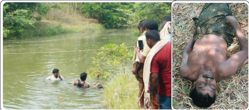
ములకలపల్లి, ఏప్రిల్ 20, ప్రజాజ్యోతి:

ఆర్ అండ్ బి అధికారులు, కాంట్రాక్టర్ నిర్లక్ష్యానికి వ్యక్తి మృతి చెందిన సంఘటన మండల కేంద్రంలో చోటు చేసుకుంది. స్థానికులు తెలిపిన వివరాల ప్రకారం ములకలపల్లి బురుగువాయి ఆర్ అండ్ బి రహదారి పై రింగిరెడ్డి పల్లి సమీపంలో పాములేరు వాగుపై ఐటిడిఎ నిధులతో హై లెవల్ వంతెన నిర్మాణ పనులు జరుగుతున్నాయి. వంతెన నిర్మాణం కోసం గుత్తేదారు అదే ప్రదేశంలో ఉన్న లో లెవల్ చస్తాను