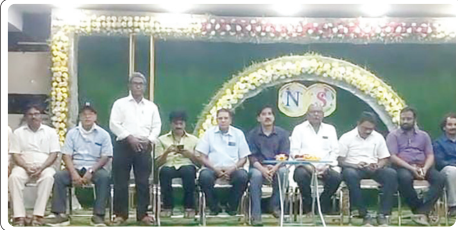
అందజేసింది. అదేవిధంగా 10వ జర్నలిజం రంగంలో విశేష తేదీన జరిగిన సభ కార్యక్రమంలో సేవలందిస్తున్న సీనియర్ జర్నలిస్ట్