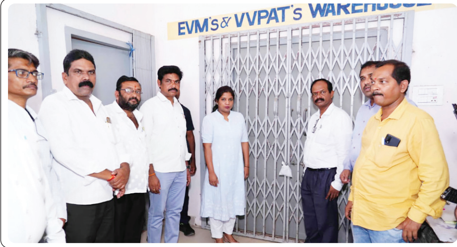
భద్రాద్రి కొత్తగూడెం బ్యారో, ఏప్రిల్ 20, ప్రజాజ్యోతి