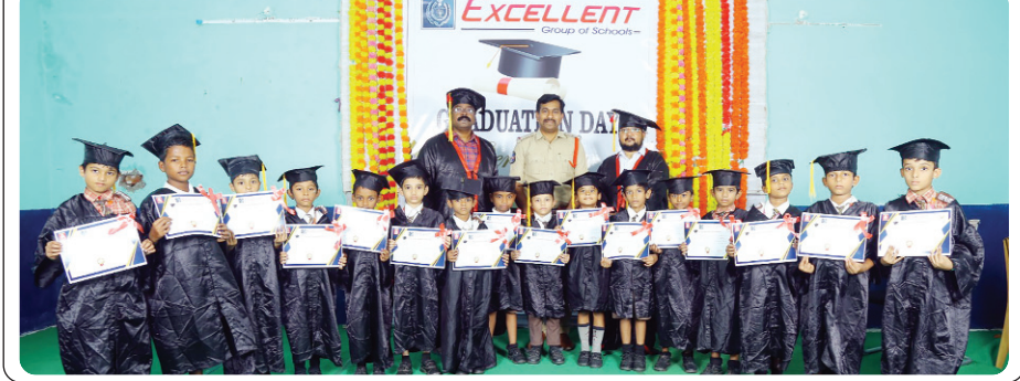
మణుగూరు రూరల్, ఏప్రిల్ 20, ప్రజాజ్యోతి: