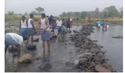
పర్యవేక్షణ లేక కాలువ గేటు పైకి క్రిందకు లేవటం లేదు ప్రస్తుతం ఎండకాలం పోలాలి వేశాం నీరు పంటలకు అందక పోవటంతో కాలువలో నీరు లేదని శ్రమదానం చేసి నీరు తెచ్చుకునే ప్రయత్నం చేస్తున్నాం.