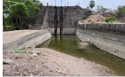
పైకి లేవలేని స్థితిలో ఉండటం సంబంధిత నీటి పారుదల అధికారులు పర్యవేక్షణ లేక పోవటం ఓ వైపు రైతుల పాలిటా శాపంగా మారింది గంగ ప్రాజెక్ట్ క్రింద ఇప్పటికే వేసిన వరి పంట పోలాలి ఎండి పోయే పరిస్థితి వచ్చింది. ఎగువన జగిత్యాల జిల్లా మూలరాంపూర్-ని ర్యల్ జిల్లా పోన్ కల్ గ్రామ శివారు లో నిర్మించిన సడరు మాటు బ్యారేజీ నిర్మాణ కాంట్రాక్టు దారులు గంగనాల మాటుకాలువకు వచ్చే పాయ లో రాళ్లు చదును చేయటం తో అయకట్టు క్రింద ఉన్న ఇబ్రహీంపట్నం మండలం లోని వేములకుర్తి, యామపూర్, ఫకిర్ కోండపూర్, మల్లాపూర్ మండలం లోనీనడీకుట, మొగి లిపెట్, ఓబులపూర్, సంగం శ్రీరాం పూర్, దామరాజుల్లి, వాలోండ అయకట్టుకు నీరు అందటం కష్టం గా మారింది రైతులు విడుదల వారిగా గంగనాల కు నీరు తెచ్చే యత్నం చేయక కష్టాలు తప్పటం లేదు. సంబంధిత శాఖ అధికారులు స్పందించి అయకట్టు ఇక్కడ నన్ను తీర్మాని అధికారులను రైతులు కోరుతున్నారు.

పంటల రక్షణకు రైతుల శ్రమదానం.. నిరంతరపోతే పంట చేతికి రావడం కష్టమే మరి