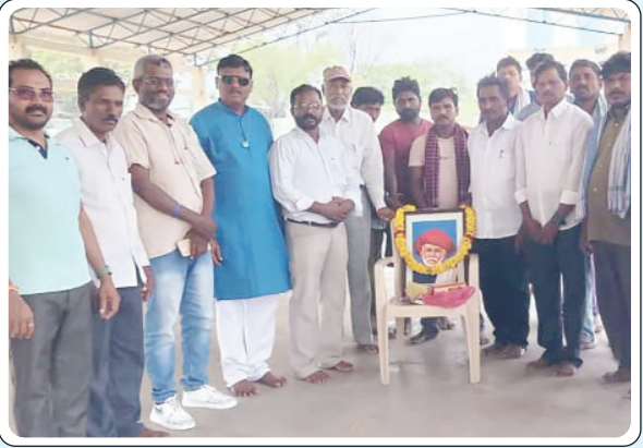
బూర్గంపహాద్, ఏప్రిల్ 11, ప్రజాజ్యోతి: