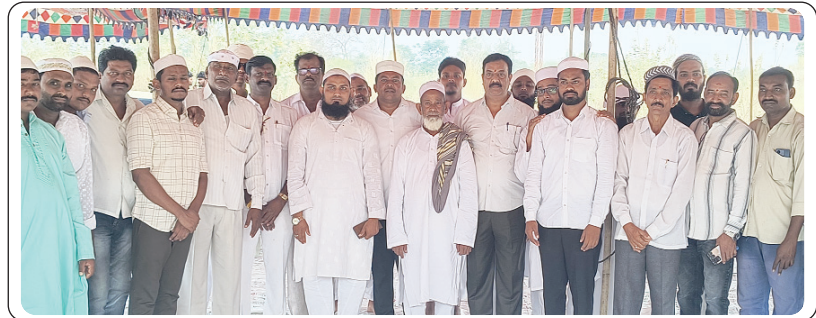
బూర్గంపహాద్, ఏప్రిల్ 11, ప్రజాజ్యోతి:

నెలరోజులుగా కఠోర ఉపవాసాలు చేసి నేడు ఈద్-ఉల్-ఫితర్ (రంజాన్) నమాజ్ ను అత్యంత భక్తి శ్రద్ధలతో ముస్లిం సోదరులు ఘనంగా పండగ జరుపుకున్నారు. బూర్గంపహాద్ మండల పరిధిలోని అన్ని మసీదులలో ముస్లిం సోదరులు భక్తి శ్రద్ధలతో