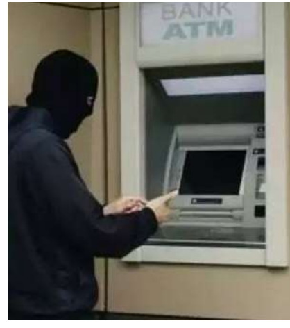
నుండి హైదరాబాద్ కి వెళ్తున్న కంటైనర్ వాహనాన్ని ఆపి తనిఖీ చేయగా అందులో సీసీ ఫుటేజ్ లో కనిపించిన వ్యక్తి మాదిరిగా ఉండడంతో వాహనాను చెందిన

జమ్మికుంట, ఏప్రిల్ 11( ప్రజా జ్యోతి ) : గత నెల 18న హుజూరాబాద్ కోర్టు పరిసర ప్రాంతాల్లోని ఏటీఎం ద్వారానే చేసి దబ్బులు ఎత్తుకెళ్లిన వారిలో ఒకరిని అరెస్ట్ చేసినట్లు హుజూరాబాద్ పోలీస్ స్టేషన్ జి తెలిపారు. వారి వద్ద నుంచి రూ. 60 వేల రూపాయల నగదును, ఒక కంటైనర్ ను స్వాధీనం చేసుకున్నట్లు ఆయన వివరించారు. గురువారం హుజూరాబాద్ పోలీస్ స్టేషన్ లో ఆయన విలేకరుల సమావేశంలో మాట్లాడుతూ... మార్చి 18వ తేదీన హుజూరాబాద్ కోర్టు ఆవరణలో ఉన్న ఎస్సీఐ ఏటీఎం ను గుర్తు తెలియని వ్యక్తులు ద్వారానే చేసి అందులో నుంచి రూ. 8.64 లక్షలు దొంగిలించారని తెలిపారు. బ్యాంకు వారి ఫిర్యాదు మేరకు కేసు నమోదు చేసుకొని దొంగలను పట్టుకోవడానికి నాలుగు టీమ్ లను ఏర్పాటు చేసినట్లు ఆయన తెలిపారు. సీసీ ఫుటేజ్ ఆధారంగా నిరంతరం పోలీస్ టీములు కరింనగర్, వరంగల్, సిద్దిపేట, హైదరాబాద్ ,కామారెడ్డి తదితర ప్రాంతాల్లో పరిశోధన చేసి ఒక అవగాహనకు వచ్చి నట్లు ఆయన తెలిపారు.సీసీ ఫుటేజ్ లో లభ్యమైన ఆధారాన్ని బట్టి ఈనెల 10వ తేదీన కరింనగర్