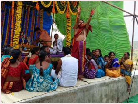
కమనీయం కడు రమనీయం