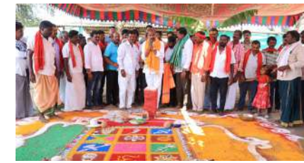
ఘనంగా పెద్దమ్మ-పెద్ది రాజుల కళ్యాణ మహోత్సవం ప్రభుత్వ విప్ ఆది శ్రీనివాస్ ప్రత్యేక పూజలు

, సుతిలి, కాంటాలు ఇప్పటికీ కల్లాలకు చేరలేదు. ప్రభుత్వం మారిన క్రమంలో ఇప్పటివరకు కొనుగోలు కేంద్రాల నిర్వహకుల నియామకం జరగలేదు. దీంతో కల్లాల నిర్వహణ ప్రశ్నార్థకంగా తయారయింది. కొనుగోలు కేంద్రాలకు ఇప్పటివరకు గన్ని సంచులు చేరలేదంటే సమస్య ఎంత తీవ్రంగా ఉందో అర్థం చేసుకోవచ్చు, అకాల, వడగండ్ల వర్షాలు వచ్చి ధాన్యం తడిసిపోతే తమ పరిస్థితి ఎంటని, దానికి బాధ్యులు ఎవరు అని రైతులు ఆగ్రహం వ్యక్తం చేస్తున్నారు. ఇదిలా ఉండగా లారీల సమస్య మరో విధంగా ఉంది. బార్దాన్, కాంటాలు చేరవేసే లారీలు ఇంతకుముందు మిల్లర్లు చేరవేసారు. ప్రస్తుతం మంథనిలో లారీ అసోసియేషన్ ఏర్పాటు కావడం ధాన్యం చేరవేసేందుకు తమ లారీలనే వినియోగించాలని అసోసియేషన్ మొండికేసి కూర్చుంది. ఈ పీఠముడిని విప్పే బాధ్యత సిబిల్ సెప్టె, పిపిసిఎస్ వారిపై ఉండగా ఎవరూ పట్టించుకున్న దాఖలాలు కనిపించడం లేదు. దీంతో సుమారు మండలంలోని 38 ధాన్యం కొనుగోలు కేంద్రాల్లో తూకం నిలిచిపోయింది. దీనిని ఆసరాగా చేసుకుని ప్రైవేటు ధాన్యం వ్యాపారులు నేరుగా పొలాల వద్దకే వెళ్లి క్వింటాలుకు రూ. 1600 చెల్లించి ధాన్యం కొనుగోలు చేస్తున్నట్లు సమాచారం. ధాన్యం కొనుగోలు లో ఎలాంటి ఇబ్బందులు రా వచ్చని జిల్లా కలెక్టర్ ప్రత్యేక సమావేశం నిర్వహించిన అధికారుల్లో ఎలాంటి మార్పు రాలేదు.