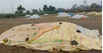
కొనుగోలు కేంద్రాల్లో ధాన్యం రాసులు ఆందోళనలో రైతులు

మంథని, ఏప్రిల్ 16 (ప్రజాజ్యోతి): ధాన్యం కొనుగోలు కేంద్రాల బాధ్యుల నియామకంలో తాత్కాలిక వల్ల ధాన్యం కొనుగోలు నిలిచిపోయింది. ఇన్స్ట్రూలర్ నియామకంలో కాంగ్రెస్ నాయకుల ఆధిపత్య పోరుకు రైతులు బలి కావలసిన పరిస్థితులు నెలకొన్నాయి. తాము సూచించిన వారినే ఇన్స్ట్రూలర్లుగా నియమించాలని గ్రామాల్లో ఆధిపత్యపరు సాగుతోంది. ఈ విషయంలో మంథని మండల కాంగ్రెస్ పార్టీ అధ్యక్షుడు ఎటు తేల్చుకోలేక పోతున్నాడని సమాచారం. కాంగ్రెస్ పార్టీ నాయకుల చర్యల వల్ల కల్లాల్లో ధాన్యం పోసిన రైతుల్లో ఆగ్రహం కట్టలు తెంచుకుంటున్నది. వర్షం పడితే బాధ్యులు ఎవరు బాధ్యులని రైతులు ప్రశ్నిస్తున్నారు. మంథని మండల పరిధిలో వెనంగి వరి కోతలు ముమ్మరము పది రోజులు దాటిపోయింది. గత పది రోజుల నుంచి వరి ధాన్యం కొనుగోలు కేంద్రాలకు చేరుతోంది. ఇప్పటికే ధాన్యం కుప్పలు తెప్పలుగా వచ్చి చేరింది. రైతులు కల్లాల్లో ఆరబోసి కాంట కోసం ఎదురుచూస్తున్నారు. వరి ధాన్యం కొనుగోలు కేంద్రాల్లో మౌలిక వసతుల ఏర్పాటు కూడా ఇప్పటి వరకు జరగలేదు. కల్లాలకు రావలసిన బార్దాన్