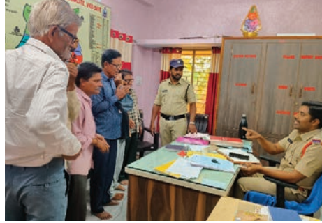
తాండూర్ మార్చి 7 ప్రజా జ్యోతి :- తాండూరు