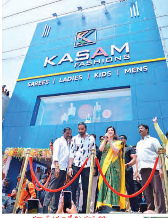
గద్వాల (ప్రజాజ్యోతి) మార్చి 06: