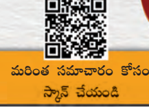
మరింత సమాచారం కోసం స్కాన్ చేయండి

ఉజ్జ్వల యోజనతో 10 కోట్ల వంట గదులకు పాగ నుంచి విముక్తి