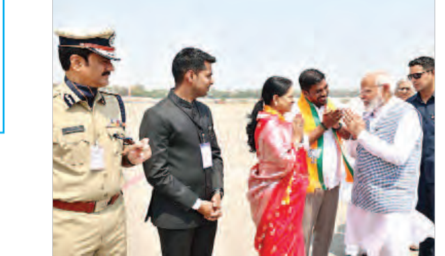
మహబూబ్ నగర్ మార్చి 6 (ప్రజా జ్యోతి బ్యూరో )

రెండు రోజులు తెలంగాణ పర్యటన ముగించుకుని ఒడిస్సా కు బయలుదేరిన ప్రధాని నరేంద్ర మోదీని బుద్ధ వారం బిజేపి జాతీయ ఉపాధ్యక్షురాలు డికే అరుణ జేగంపేట విమానాశ్రయంలో వీడ్కోలు పలికారు.