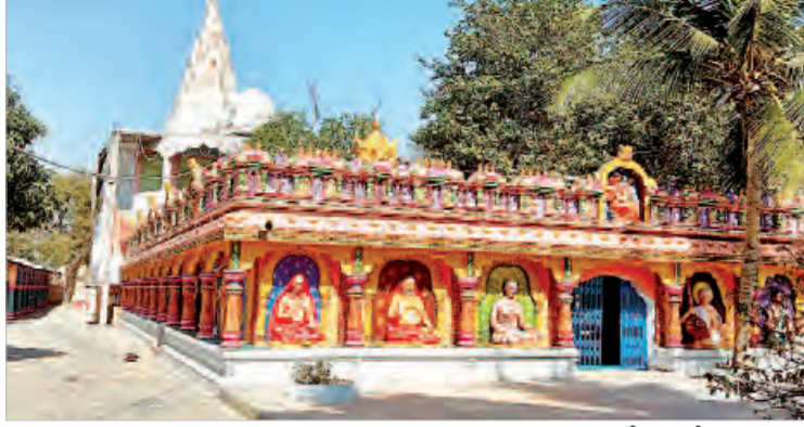
మజ్జల్ నియోజకవర్గ ప్రతినిధి, మార్చి 06 (ప్రజా జ్యోతి):