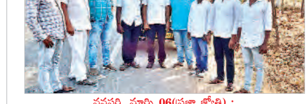
వసవర్తి, మార్చి 06(ప్రజా జ్యోతి) :