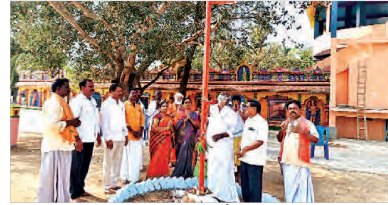
కళ్యాణ మహోత్సవం జరగనుంది. 12వ రోజుకు మాత భోజన కార్యక్రమం జరగనుంది. మహాశివరాత్రి జాగరణ సందర్భంగా శు క్రవారం రాత్రి శ్రీ మంజునాథ స్వరూపుని