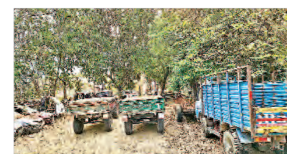
ముఖ్య నియోజకవర్గ ప్రతినిధి, మార్చి 19 (ప్రజాజీవితం):

నారాయణపేట జిల్లా ముఖ్య నియోజకవర్గంలోని నర్స మండలంలో ఆక్రమంగా ఇసుకను తరలిస్తున్న ట్రాక్టర్లను పట్టుకుని కేసు నమోదు చేసినట్లు ఎస్పీ కురుమయ్య తెలిపారు. ముఖ్య నియోజకవర్గ ప్రతినిధి గ్రామానికి చెందిన మూడు ట్రాక్టర్ల ద్వారా ఇసుకను తరలిస్తూ ఉన్నట్లు తెలుసుకుంటూ మూడు ట్రాక్టర్లను పట్టుకుని కేసు నమోదు చేశామని తెలిపారు. మూడు ట్రాక్టర్లను పట్టుకుని కేసు నమోదు చేశామని తెలిపారు. ఎవరైనా ప్రభుత్వ అనుమతి లేకుండా ఆక్రమంగా ఇసుక తరలిస్తే కేసు నమోదుతో సహా, కఠిన చర్యలు తీసుకుంటామని హెచ్చరించారు.