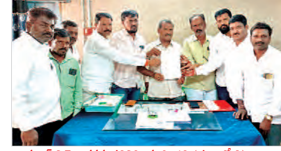
ముఖ్య నియోజకవర్గ ప్రతినిధి, మార్చి 19 (ప్రజా జీవితం):