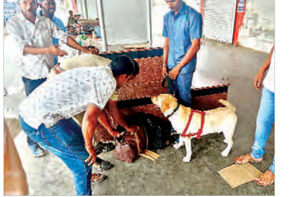
ముఖ్య నియోజకవర్గ ప్రతినిధి, మార్చి 19 (ప్రజా జీవితం):