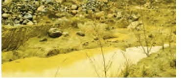
మాక్కూర్, ప్రజాజ్యోతి, మార్చి 19