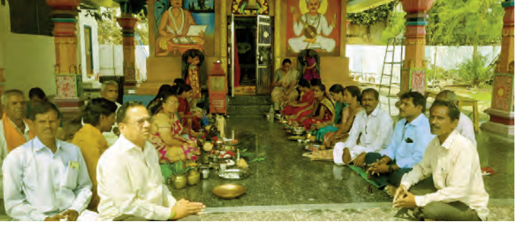
రుద్రూర్, మార్చి 19 (ప్రజా జ్యోతి) :