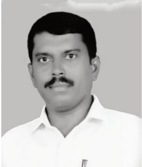
హుస్సాబాద్, మార్చి 18 (ప్రజా జ్యోతి): ముదిరాజులకే