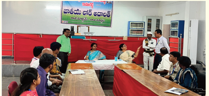
కామారెడ్డి జిల్లా ప్రజాజ్యోతి ప్రతినిధి మార్చి 16.