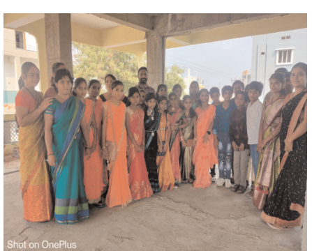
Shot on OnePlus