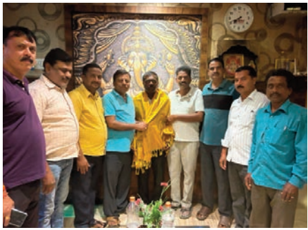
కామారెడ్డి జిల్లా రామారెడ్డి ప్రజా జ్యోతి మార్చి 16