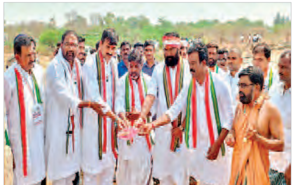
రాష్ట్ర ముఖ్యమంత్రి సూచన మేరకు 12 కోట్ల రూపాయలు మంజూరు