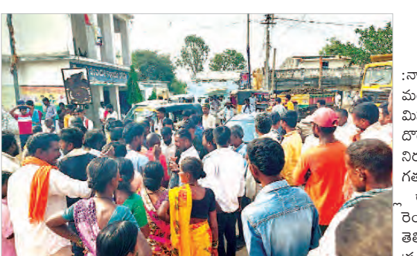
ఇబ్బందులకు గురయ్యారు. దోరేపల్లి గ్రామానికి పోలీసులు, అధికారులు చేరుకొని సందడిత అధికారులతో మాట్లాడి సమస్య పరిష్కరిస్తామని హామీ ఇవ్వడంతో గ్రామస్థులు ధర్మాన్ని విరమించారు. జిల్లా అధికారులు స్పందించి వెంటనే మిషన్ భగీరథ నీళ్లు వచ్చేలా చూడాలని గ్రామ ప్రజలు డిమాండ్ చేశారు.

నారాయణ పేట జిల్లా మద్దూరు మండల పరిషత్లోని దోరేపల్లి గ్రామంలో మిషన్ భగీరథ నీరు రావడం లేదని దోరేపల్లి గ్రామ ప్రజలు రోడ్డు పై ధర్మా నిర్వహించారు. దోరేపల్లి గ్రామంలో గత 10 రోజుల నుండి త్రాగడానికి నీరు రావడం లేదని రోడ్డుపై దాదాపు రెండు గంటల పాటు నిరసన తెలిపారు. ఇతర గ్రామాలకు వెళ్లే ప్రయాణికులు ట్రాఫిక్ సమస్యతో