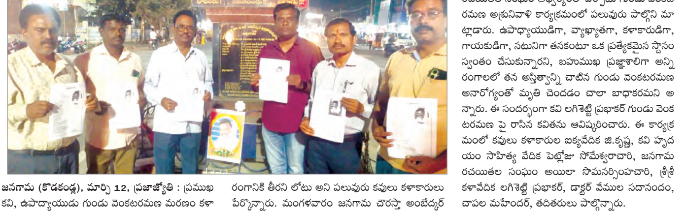
జనగామ (కోడకండ్ల), మార్చి 12, ప్రజాజ్యోతి: ప్రముఖ రంగానికి తీరని లోటు అని పలువురు కవులు కళాకారులు పేర్కొన్నారు. మంగళవారం జనగామ చొర్రపల్లి అంబేద్కర్