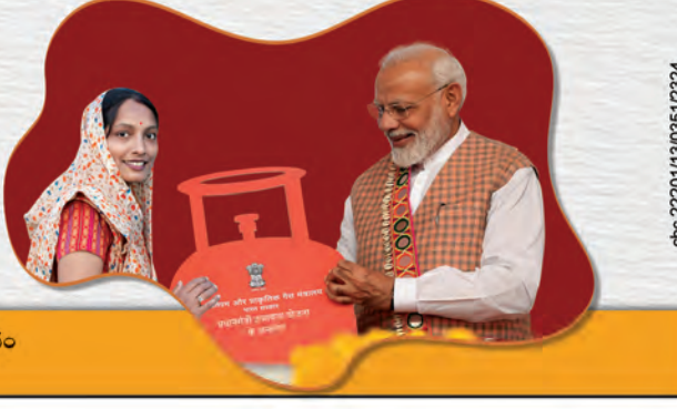
మరింత సమాచారం కోసం స్కాన్ చేయండి

ఉజ్జ్వల యోజనతో 10 కోట్ల వంట గదులకు పాగ నుంచి విముక్తి