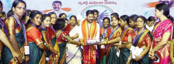
ఆశీర్వాదం వల్లే రాష్ట్రంలో కాంగ్రెస్ పార్టీ అధికారంలోకి వచ్చిందన్నారు. సికింద్రాబాద్ వరల్డ్ మైదానంలో ఏర్పాటు చేసిన సభలో 'మహాలక్ష్మి స్వశక్తి మహిళా పథకాన్ని సీఎం ప్రారంభించారు. మూడు తప్పకుండా.. మడమ తిప్పుకుండా సోనయాగాండ్ మిగతా 2లో..

ఆడబిడ్డల ఆశీర్వాదం వల్లే కాంగ్రెస్ కు అధికారం మహాలక్ష్మి స్వశక్తి మహిళా పథకాన్ని ప్రారంభించిన సీఎం రేవంత్ హైదరాబాద్, మార్చి 12: తెలంగాణలో కోటి మహిళలను కోటిశ్వరులుగా చేయడమే తమ ప్రభుత్వ లక్ష్యమని ముఖ్యమంత్రి రేవంత్ రెడ్డి అన్నారు. ఆడబిడ్డల