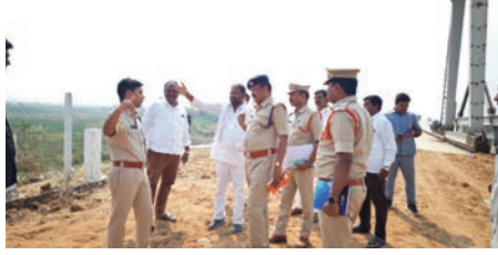
ఆత్యకార్ ప్రజా జ్యోతి మార్చి 12 నారాయణపేట జిల్లా మక్కల్ మండలంలో నేడు రాష్ట్ర ఉపముఖ్యమంత్రి బట్టి