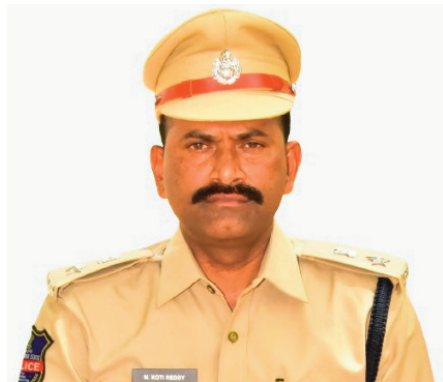
వికారాబాద్ ప్రతినధి మార్చి 12 (ప్రజా జ్యోతి): ఈనెల