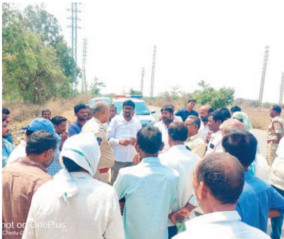
తమ పంట పొలాలు ఎండిపోతున్నాయని ఆగ్రహించిన రైతులు సిద్దిపేట-హనుమకొండ రహదారిపై రాంపూర్ క్రాసింగ్ వద్ద గణపూర్ అక్కినపల్లి గ్రామాల రైతులు సోమవారం నాడు రాస్ట్రాకోలో చేశారు. ఈ రాస్ట్రాకోలో