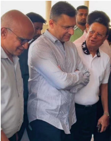
హైదరాబాద్, మార్చి 11 (ప్రజా జ్యోతి) : తలసేమియా సికిల్ సెల్ సొసైటీ(టీఎస్ సీఎస్) సోమవారం హైదరాబాద్లోని గుడిమల్యాపూర్లోని కింగ్స్ ప్యాలెస్లో మెగా రక్తదాన శిబిరాన్ని నిర్వహించింది.

- శిబిరాన్ని సందర్శించిన ఎమ్మెల్యే అక్బరుద్దీన్ ఒవైసీ