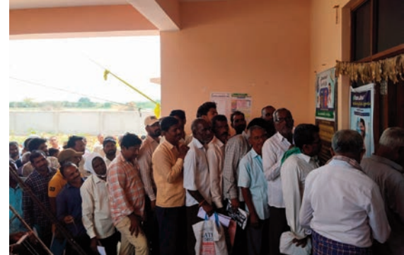
లబ్ధిదారుల ఎంట్రీని చేసే విధంగా చర్యలు తీసుకోవాలని ఆఫీస్ చుట్టూ నిరుపేదలను తిప్పకోవడం సమంజసం కాదని ఆరోపించారు.