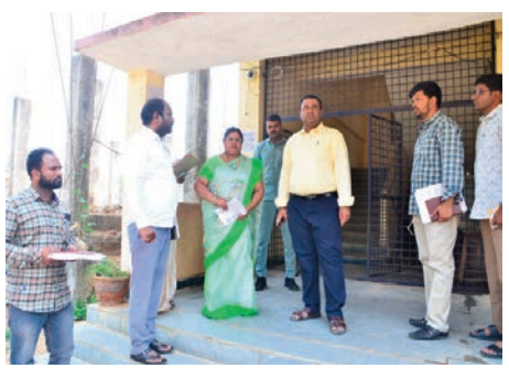
ప్రతినిధి మెదక్ ప్రజాజ్యోతి : మార్చి 11, 2024 రానున్న లోక్ సభ ఎన్నికల దృష్ట్యా ఈవీఎల భద్రత, డిస్ట్రిబ్యూషన్, రిసెప్షన్ కేంద్ర ఏర్పాటుకు ప్రతిపాదిత భవనాలను జిల్లా ఎన్నికల అధికారి, జిల్లా కలెక్టర్

- ప్రతి పాఠిత భవనాలను పరిశీలించిన జిల్లా కలెక్టర్