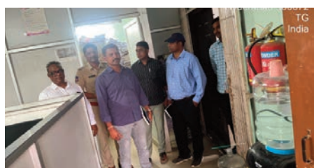
కూకట్ పల్లి, ఫిబ్రవరి 29 (ప్రజా జ్యోతి) : కూకట్ పల్లి ప్రకాంత్ నగర్ లోని రంగారెడ్డి జిల్లా రిజిస్ట్రార్ కార్యాలయంలో