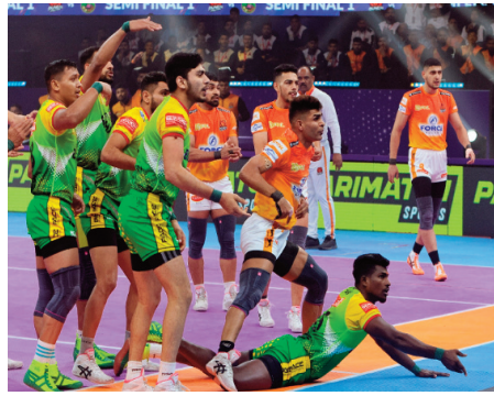
హైదరాబాద్, ఫిబ్రవరి 29 (ప్రజా జ్యోతి) : పుణెరి

- సెమీస్ లో పట్నా ఫైరెట్స్ పై 37-21తో గెలుపు